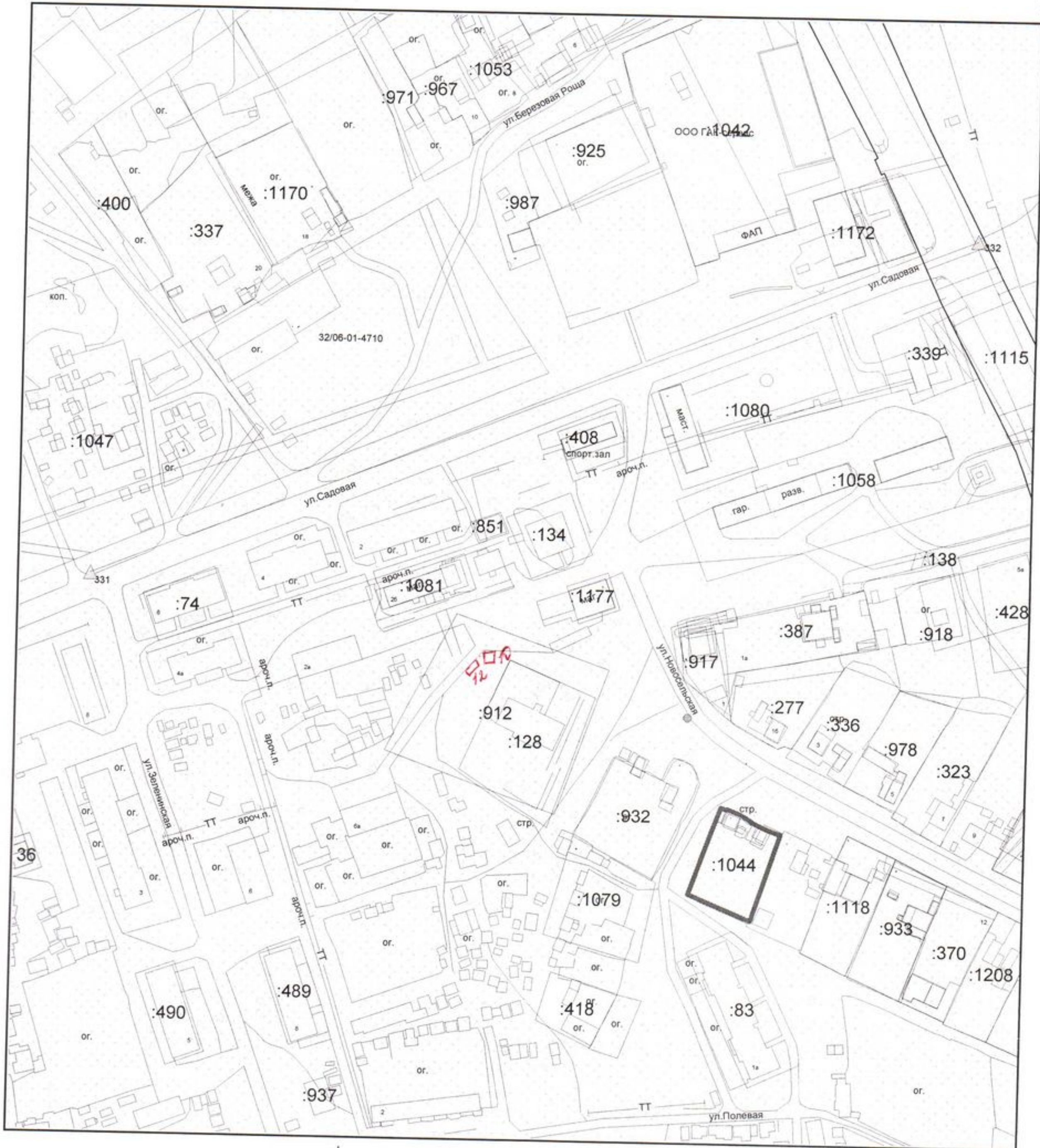
Схема расположения нестационарных торговых объектов на территории Усть-Качкинского сельского поселения с 27.01.2016 по 31.12.2019