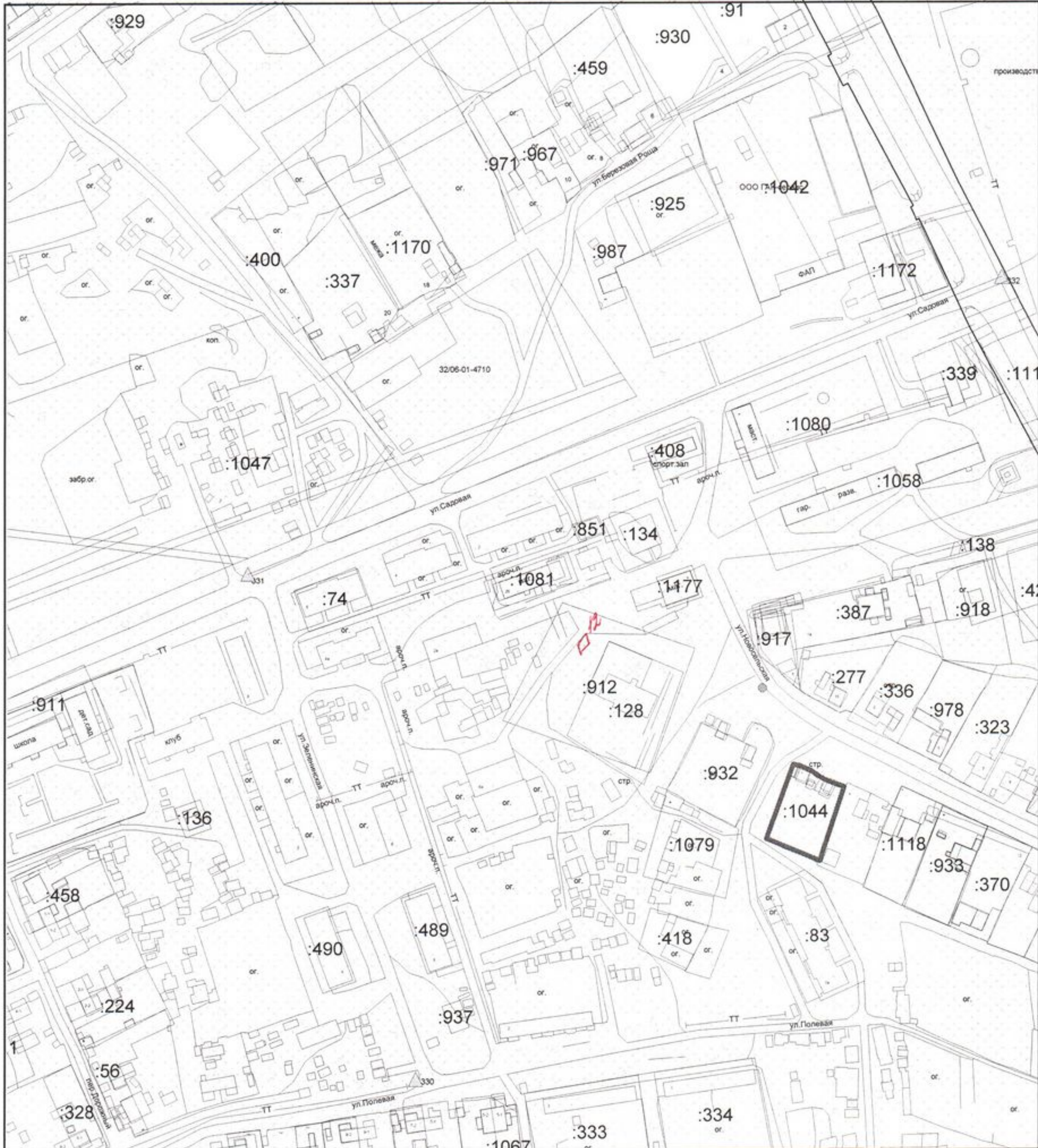
Схема расположения нестационарных торговых объектов на территории Усть-Качкинского сельского поселения с 09.08.2016 по 31.12.2019